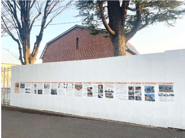
写真5 説明シート全体

現在、正門に関する説明を掲出している（写真5、6）。さらに、平和の森小学校及び中野中学校の児童・生徒が制作した絵の掲出を3月中に予定している。