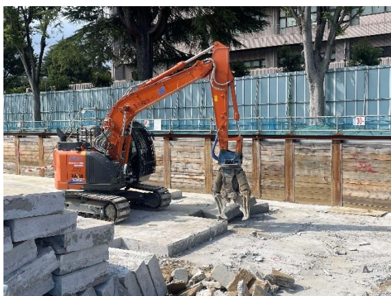
写真1 耐圧盤の撤去