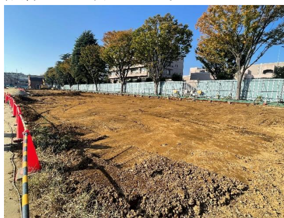
写真2 埋め戻し後の曳家経路