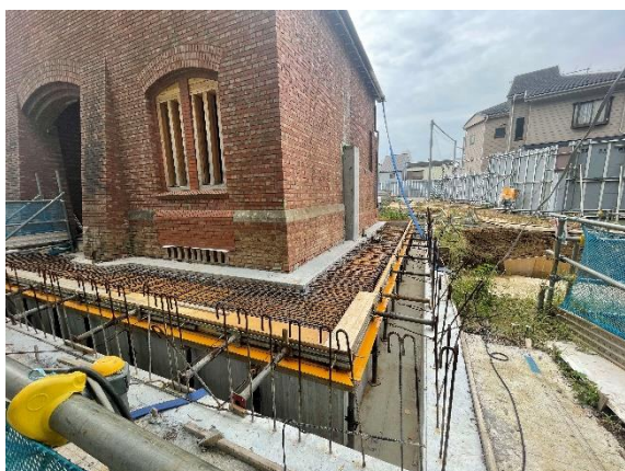
写真3 犬走りの配筋