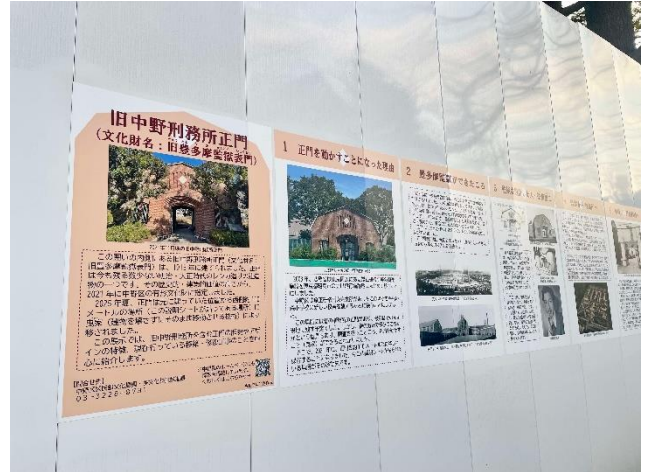
写真6 説明シート近接