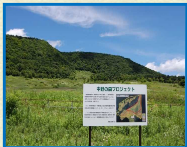
群馬県みなかみ町

「群馬県みなかみ町」では、牧場跡地に「中野の森」をつくり、森を育てています。 「福島県喜多方市」では、増えすぎた森の木を間伐する森林整備をお手伝いをしています。 区民の方にも、寄付をいただいたり、みなかみ町や喜多方市を訪問し、「植樹体験」や「森林学習」などをさせていただいています。