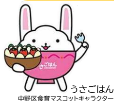
うさごはん 中野区食育マスコットキャラクター

クリスマスパーティー、忘年会や新年会などの集まりで宴会や外食の機会が増える季節。わいわい盛り上がるなど楽しい一方、宴会での食べ残しの量は、ランチや定食の5倍にも上るとか。もったいないですね。