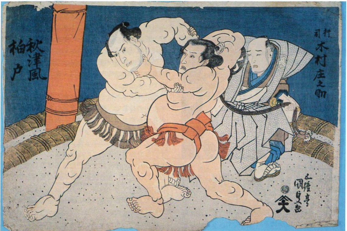
「秋津風・柏戸」初代歌川国貞画（天保初年）当館所蔵 山崎家資料