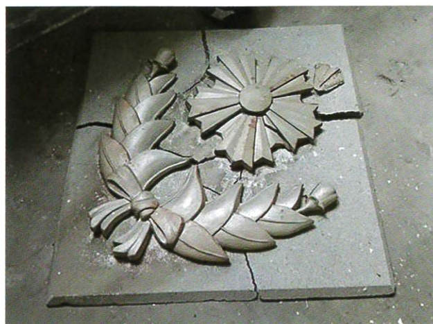
表門（旭日章）の紋章（現在、門内部に保管中）