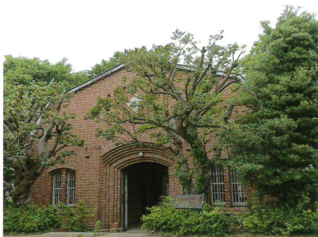
旧中野刑務所正門（文化財名：旧豊多摩監獄表門）