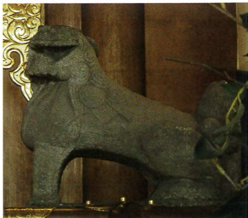
東中野氷川神社社殿内の狛犬(江戸尾立ち型)

中野区の狛犬の形状は大別して①江戸尾立ち型 ②江戸流れ尾型 ③昭和はじめ型 ④岡崎現代型があり、時代が下るにつれ大型化し、いかめしい顔になっています。(北河)