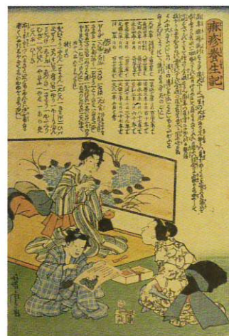
歌川芳虎「麻疹養生記」（文久2年（1862）、当館蔵）

現代においても、疫病に打ち勝つためにはうがい・手洗い・睡眠と並んで適切な食事が重要だと言われます。「薬も過ぎれば毒となる」とはよくいったものです。（富井）