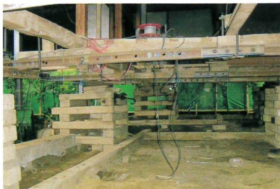
建物本体をジャッキで持上げ井桁架台にのせた様子

まず、建物本体をジャッキで持上げました。この工程と元の位置に降ろす工程が最も困難な作業で、油圧ジャッキを使い時間をかけて少しずつ持上げ6基の井桁架台 いげたかだい の上に建物本体をのせました。この工程は、僅かな操作ミスによって余分な応力が柱や壁などに加わり、建物の内壁が崩壊してしまう危険性が高く、水平の保持と振動を与えぬよう細心の注意を払いました。つぎに土台石を掘り起こし、コンクリート盤の基礎を打ちました。そのうえに既存の土台石を元の位置に戻し、土台は新しい部材にすべて取換え、建物の歪みを修正しながら慎重に降ろしました。