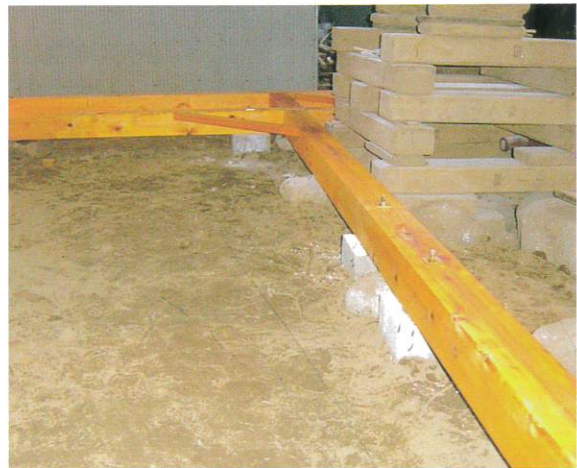
コンクリート盤の基礎と土台を固定した様子