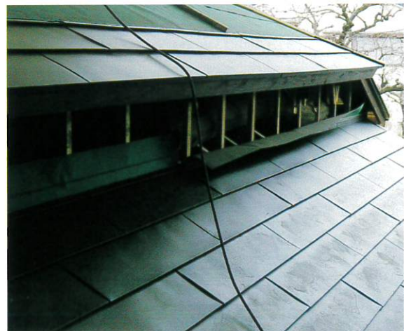
瓦をすべて撤去したのち鉄板葺きに張替えた様子

まず、屋根瓦をすべて取り除き、黒色の鉄板で全面葺き替えました。屋根材は、当初は瓦葺きではなかったこともあり、耐震性を高めるため瓦に比べて軽い鉄板葺きとしました。外壁は、南一西側は下見板 したみいた の張替えを行い、北一東側は波板鉄板張り なみだ としました。