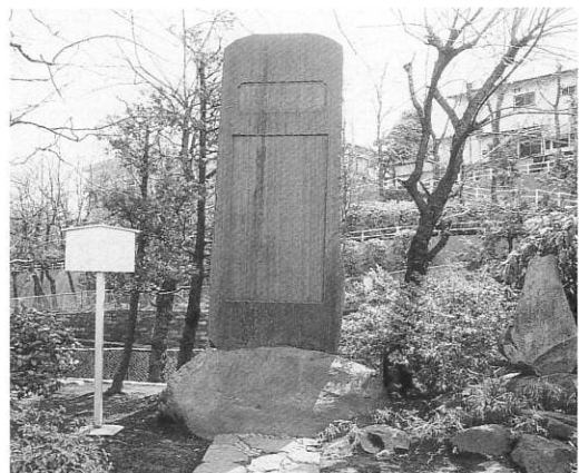
題字は画家小杉放庵による

耕作道で路面が悪く、両側には並木と雑草、すすきが生い茂って、道とは名ばかりの田畑の間道であった。その頃は田畑の中に点々と屋敷林に囲まれた草葺屋根の農家があって、武蔵野の名残をとどめていた。」日清、日露戦争頃から、東京の人口は急速に増え、特に関東大震災後は、東京近郊の市街地化が進む一方でした。こうした流れを受けて、都市化に備えて、道路・水路を整備し、河川を改修し、橋を架け、公園完備し、住宅地として整備しました。この一大事業を今に伝えるのが、公園の西側に建つ整地碑です。