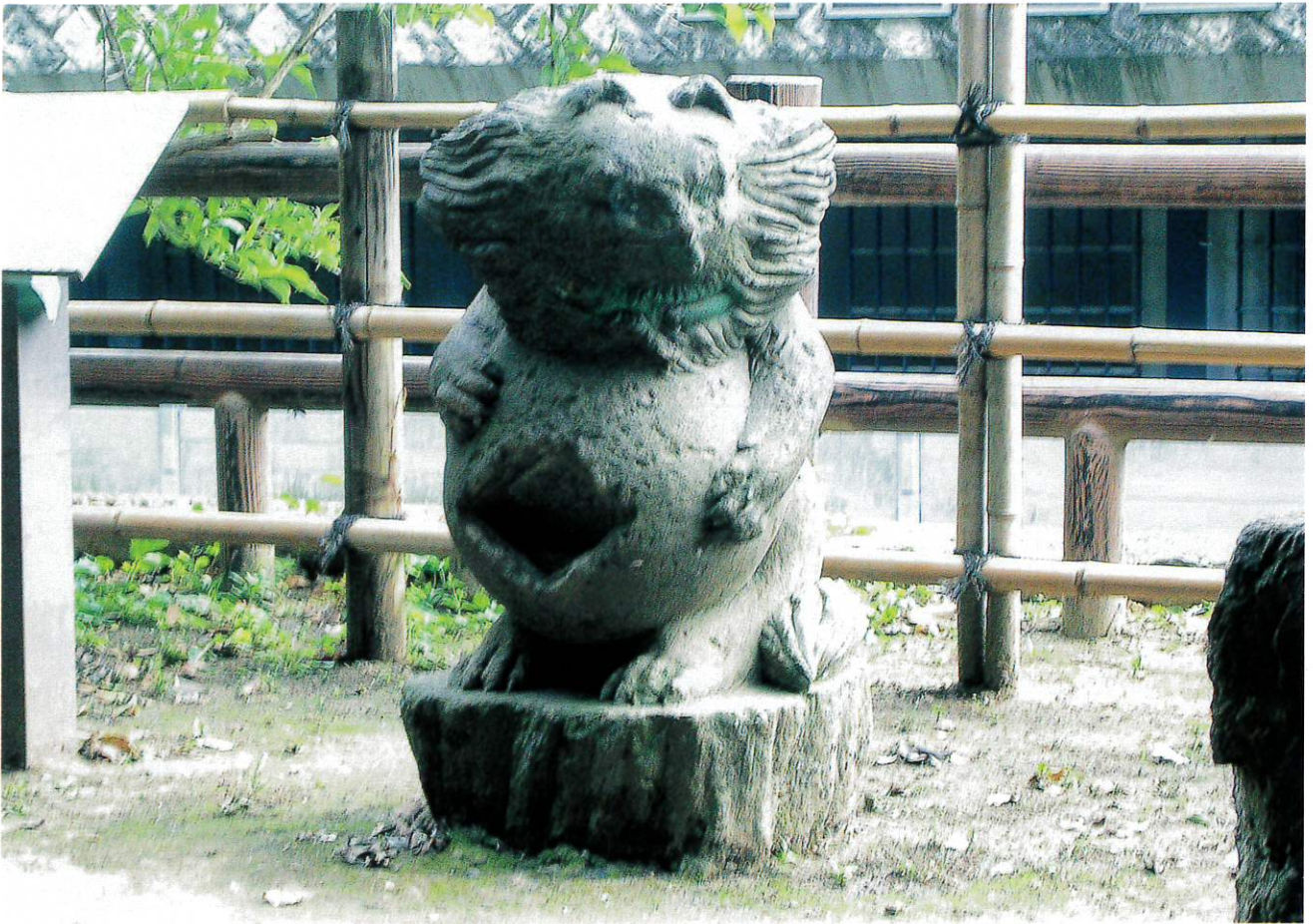
哲学堂唯物園にある狸の燈籠