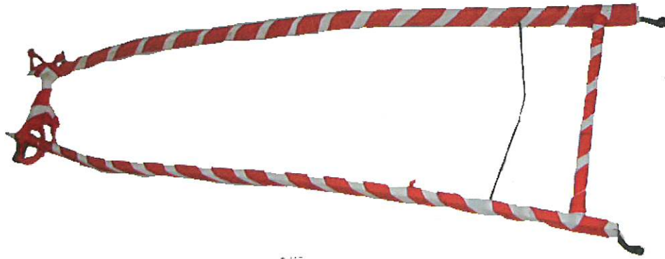
ながえ 轆 (長柄)

これは山車を引くためのものです。花山車の前につけられていました。本来は、牛馬に引かせるためのものですが、人間が引いていたこともあったようです。この轆を使用していたかどうかは分かりませんが、昭和35年(1960)ごろには牛が山車を引いていました。