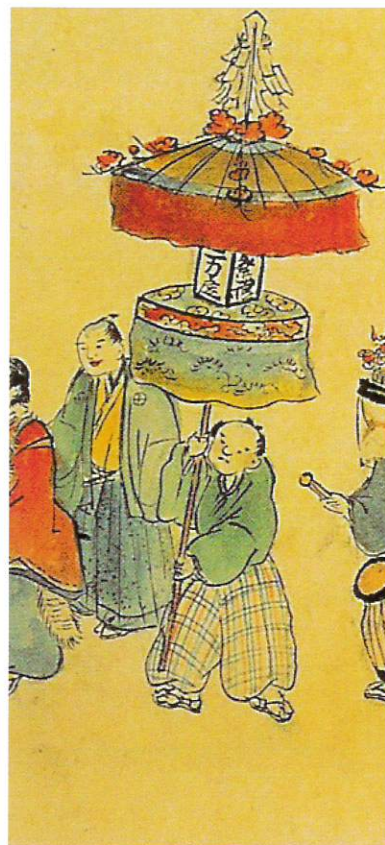
▲江古田獅子舞行列絵巻