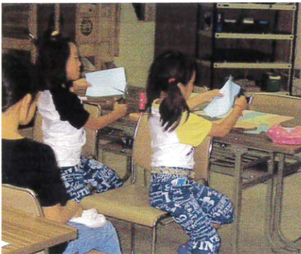
「障子はり」「勾玉づくり」「紙によるオモチャづくり」の様子