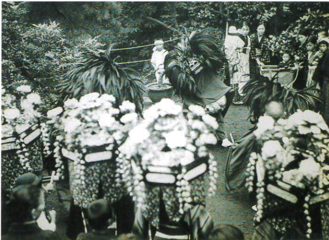
▲庭で舞う江古田獅子舞〈昭和10代〉

獅子頭をつけ太鼓を叩きながら踊る一人立ち三匹獅子は東日本に多く見られる形ですが、方位を司る青竜・白虎・朱雀・玄武の四神を配している点は、全国でも珍しい特徴のひとつです。