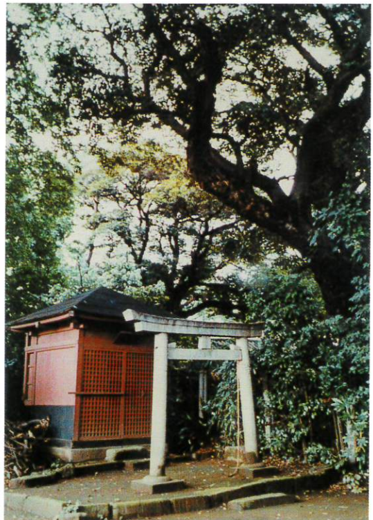
▲椎の下の椎の宮（館蔵・山崎家アルバムより）