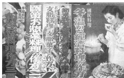
◀左から 昭和13・ 14・15 15・16年 昭和17～ 29年は資料を欠く

不確かなイメージだけで知っているようなつもりになってはいけなと、またまた反省です。