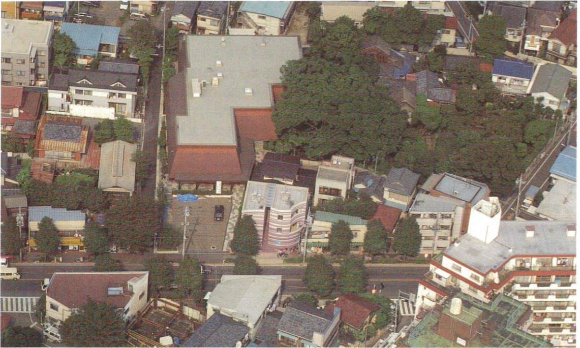
中野区立歴史民俗資料館上空より