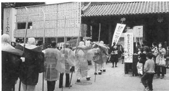
▲節分の日におこなわれる宝仙寺・僧兵行列

豆をまくのは、それが邪鬼を打ち払う呪能（目つぶし）をもっているからだといわれています。そればかりでなく、豆は「まめにこつこつと暮らせるように」という願いがこめられているという縁起のいい食べ物として、米と同様に大切にされています。