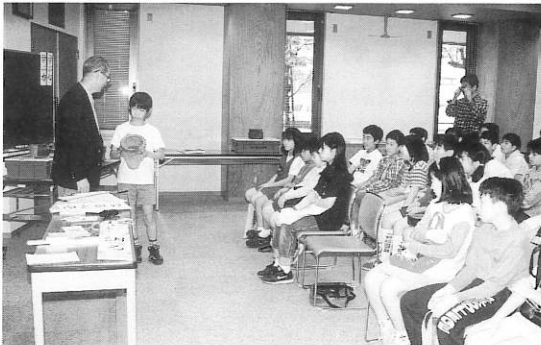
▲区内小学生、資料館見学のひとこま