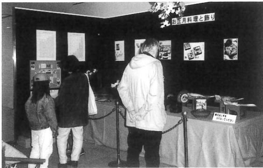
▲「正月展開催風景」(正月料理に見入る)