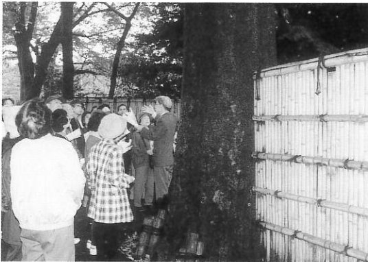
▲史跡めぐり(たきびのうた発祥の地)