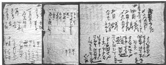
▲シワの痛々しい新「発見」古文書群の一部

ずですが、なぜか古文書としての分別を行っておらず、くわえて「発見」者から古文書担当に連絡がきても、実際に調査をす