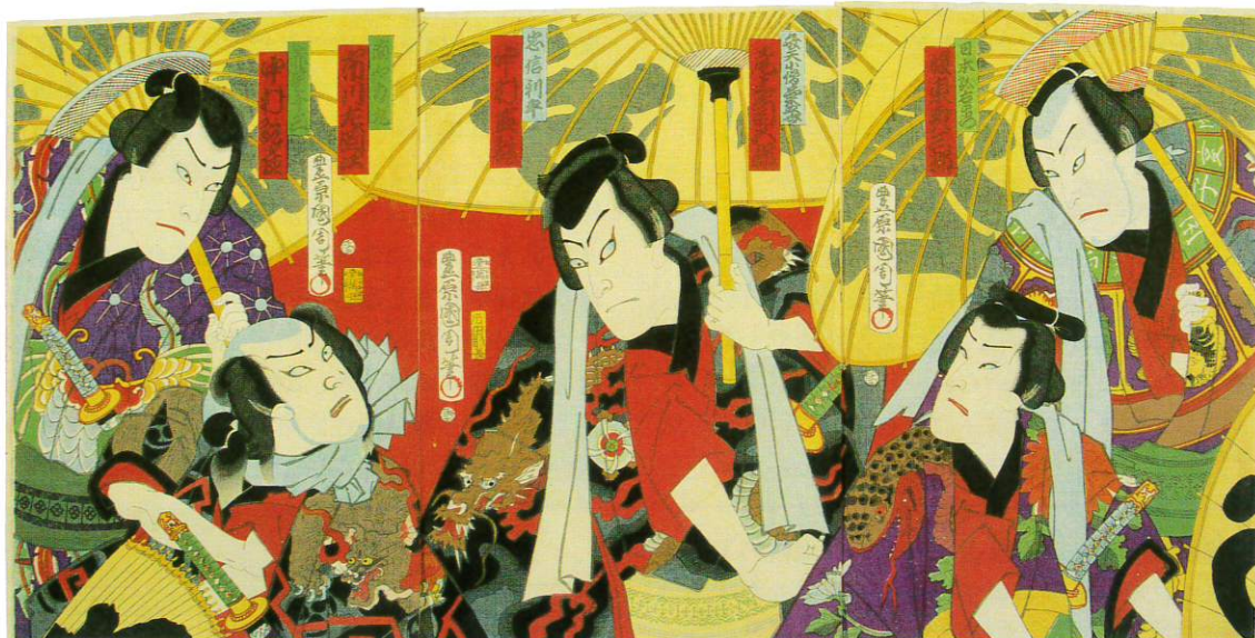
河竹黙阿弥作「白浪五人男」 豊原国周画