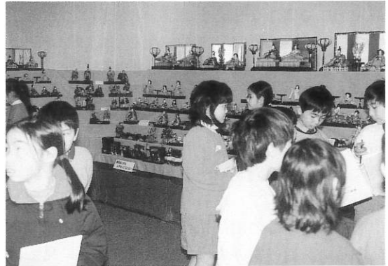
▲おひなさま展（見学する子供達）

「中野区の仏教美術」 「御嶽遺跡第1次発掘調査報告書」が刊行されました。区内の仏像調査・戦国時代の遺跡の報告書です。