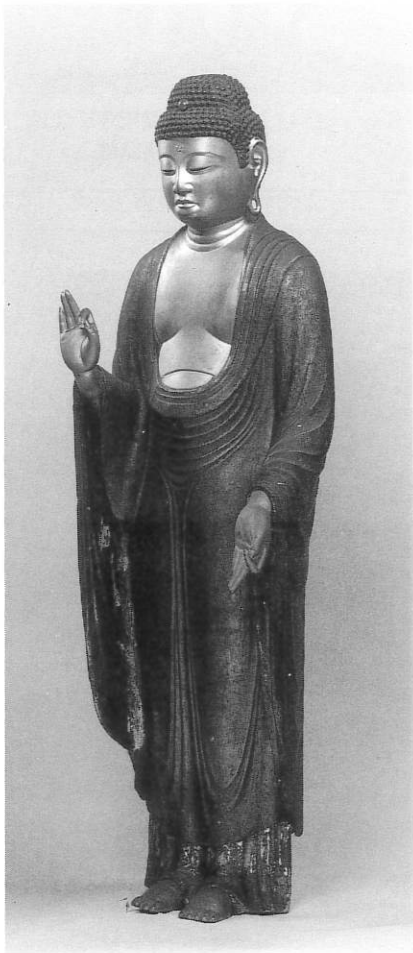
1. 阿弥陀如来立像 貞源寺