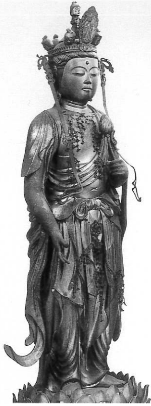
4. 十一面観音立像 福蔵院