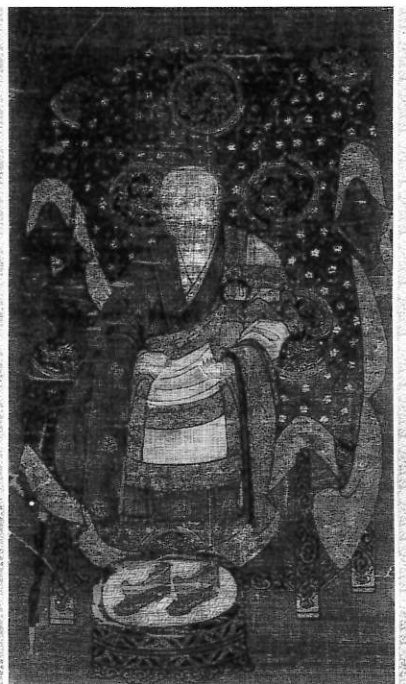
2. 川庵宗鼎像 成願寺