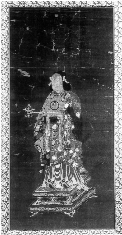
4. 聖徳太子像 源通寺