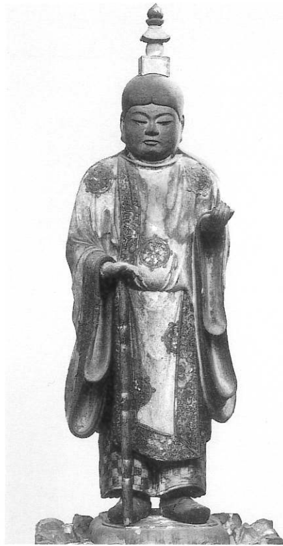
6. 雨宝童子立像 福蔵院