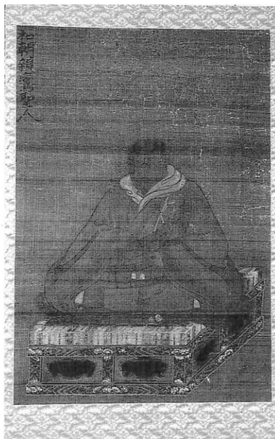
3. 親鸞聖人像 源通寺