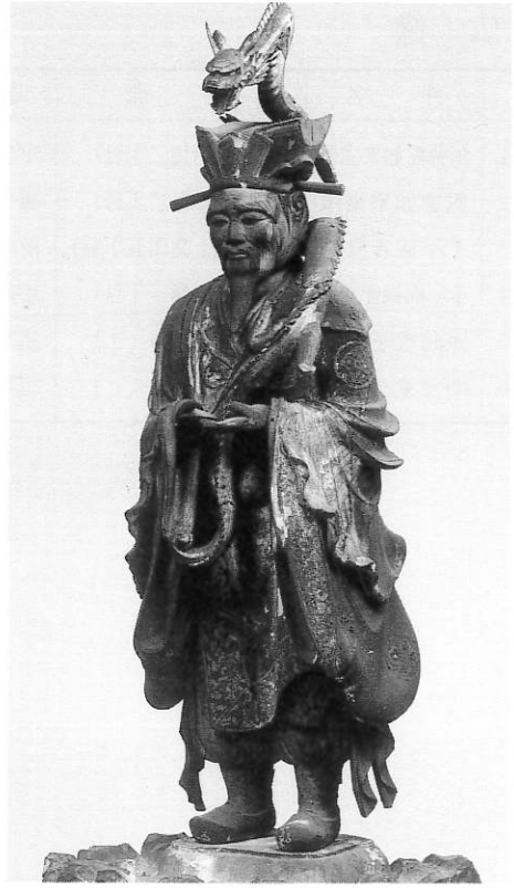
5. 難陀竜王立像 福蔵院