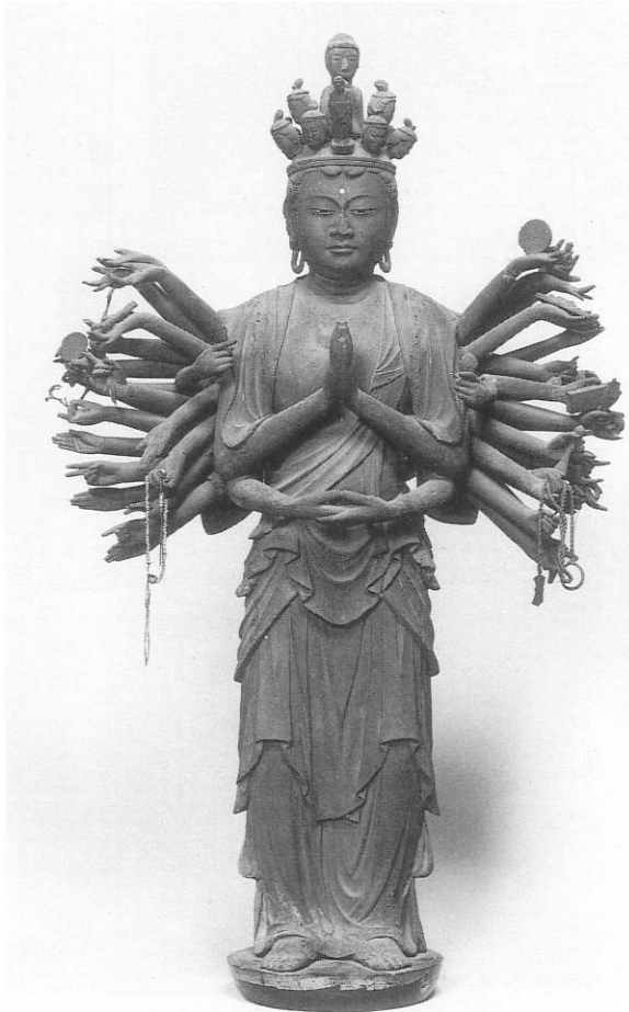
3. 千手観音立像 光徳院