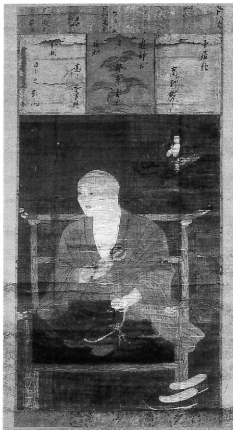
1. 弘法大師像 密蔵院