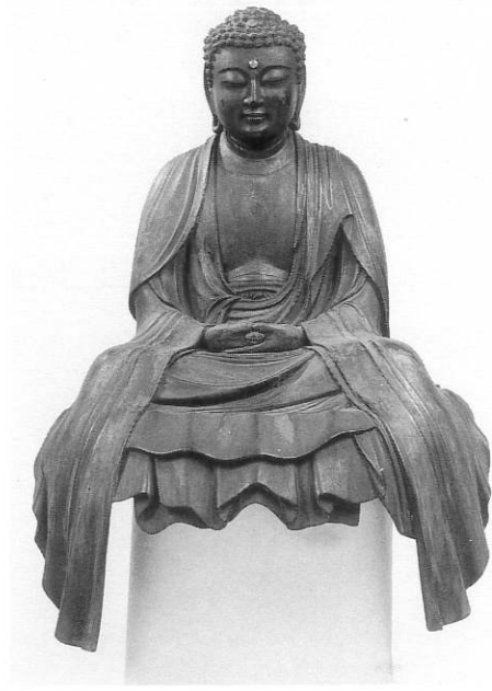
2. 釈迦如来坐像 成願寺