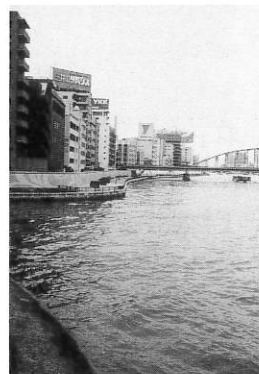
▲神田川の水源にあたる「井ノ頭ノ池辨天の社」(左)と、墨田川と合流した「浅草川大川端宮戸川」(右)

※江戸東京百景今昔展は11月18日(土)まで開催しています。また、同展図録も刊行しましたのであわせて御覧下さい。