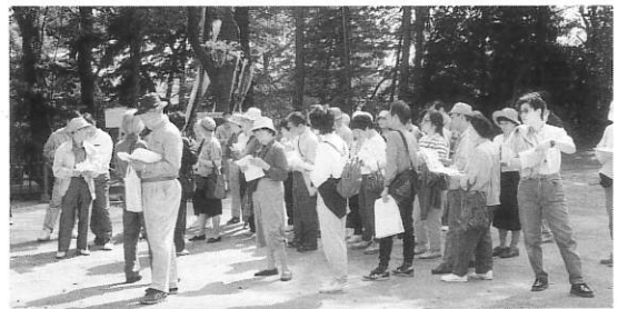
▲史跡めぐり「沼袋コース」巡行風景

++++ NEWS +++++ * 平和展のお知らせ 太平洋戦争と中野区民のくらしのテーマで平和展が開催されます。戦中戦後の区民のくらしを写真と資料で綴ります。 場所：平和資料展示室（平和の森公園内） 期間：7月3日(土)～10月28日(木) * 郷土学習相談室を開設 小中学生を対象に、中野の歴史についてのご質問にお答え致します。8月24～27日の10～12時、1～3時迄です。（9時30分から受付）