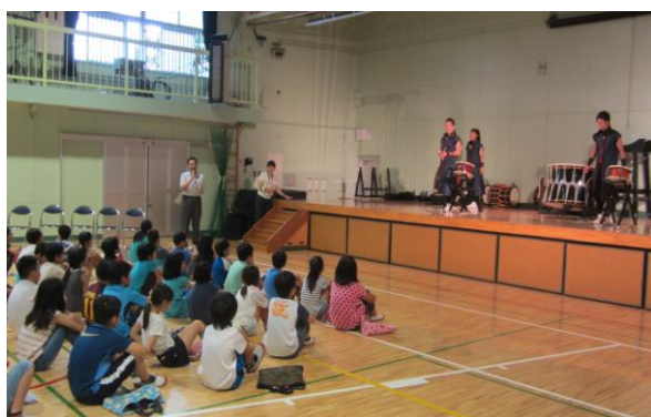
和太鼓 暁 の演奏を真剣に聴く児童たち

統合対象校では、統合後の学校運営を円滑に行うために交流事業を実施しています。今年度の第1回目として、6月29日に新山小・中野神明小・多田小の4年生が参加した「和太鼓教室」が行われました。