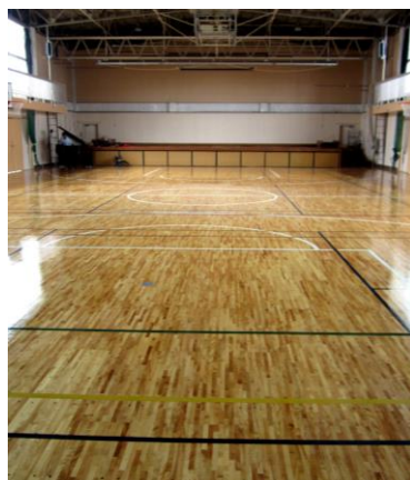
体育館の床 ピカピカです

トイレの洋式化、体育館の床磨き・ライン引き、階段の改修等を実施し、とてもきれいで明るくなりました。また、統合により児童数の増加が見込まれるため、普通教室の整備、給食室の改修を行いました。