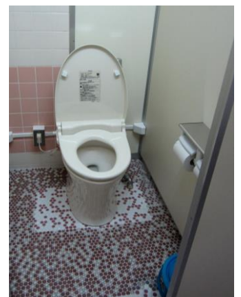
トイレが洋式化されました

編集・発行：多田小学校・新山小学校統合委員会 事務局：中野区教育委員会事務局学校再編担当 TEL：03-3228-5548 FAX：03-3228-5679