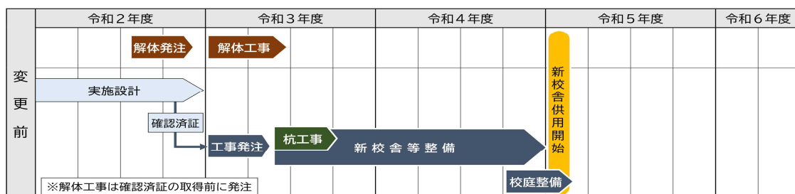
鷺宮小学校・西中野小学校統合新校 新校舎等整備スケジュール

※「鷺宮小学校・西中野小学校統合新校の新校舎等整備について」の詳細につきましては、中野区教育委員会ホームページをご覧ください。