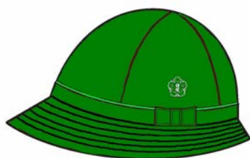
〈通学帽子イメージ〉