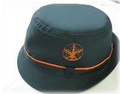
平和の森小学校の通学帽子 (深緑にオレンジの刺繍)