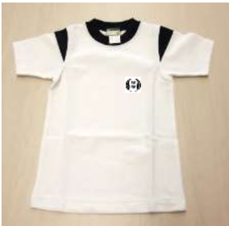
緑野小学校の体操着 (紺色のライン・校章)