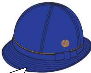
通学帽子 パイピングハイバック型リボン付 ラインと校章は黄色の刺繍