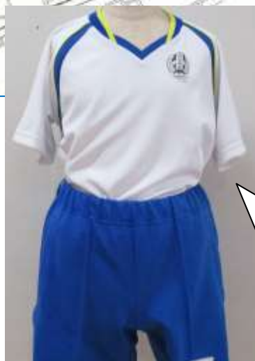
体育着上下 上：首元と肩にブルーのライン 左胸に校章 下：セミハーフ

体育着の上下と通学帽子はスクールカラーであるブルーで統一しています。なお、体育着の上下と通学帽子は、南台小学校と色違いになっています。(南台小学校は紺色)