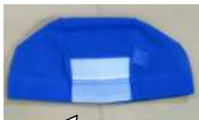
水泳帽子 紺色、マジックテープ付