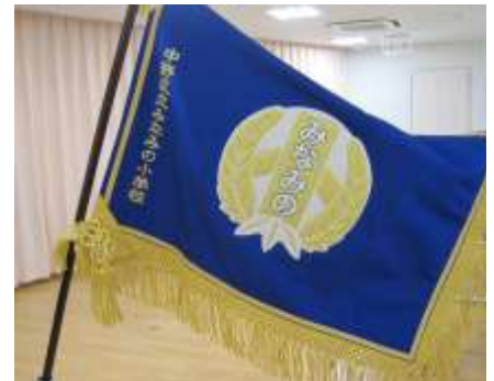
みなみの小学校の刺繍校旗