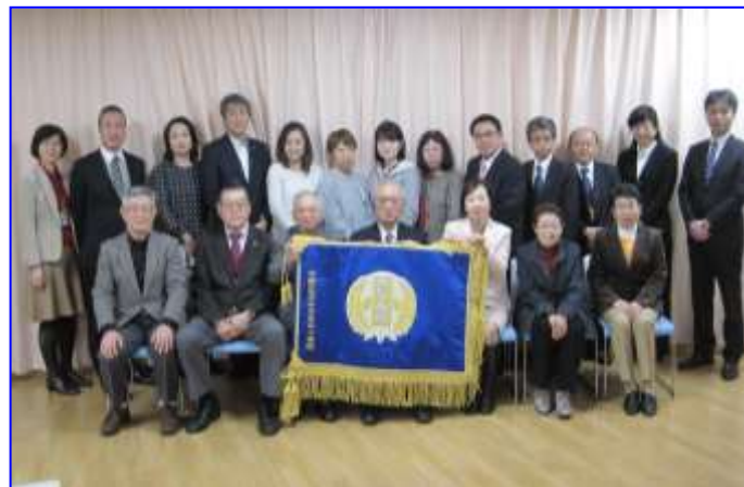
みなみの小学校校旗を囲んで記念撮影

* 委員皆さんの協力とお力添えのもと統合委員会を無事終了できたことが本当に嬉しい。改めて皆さんのご尽力に感謝したい。今後も統合に関わった者として新しい学校を支えていきたい。