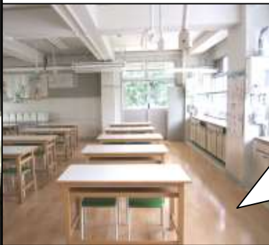
家庭科室(右)・理科室(左) 床改修を行いました