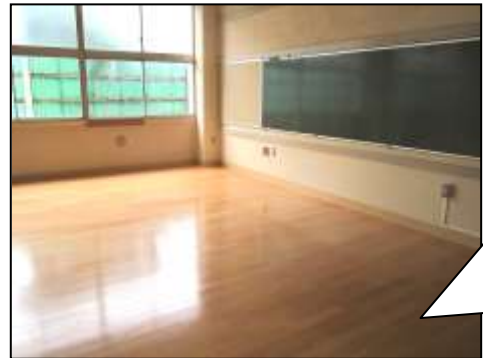
他の目的で使用していた教室 普通教室に整備されました

中野神明小学校・新山小学校統合委員会ニュース第 11 号 編集・発行：中野神明小学校・新山小学校統合委員会 事務局：中野区教育委員会事務局学校再編担当 TEL：03-3228-5548 FAX：03-3228-5679