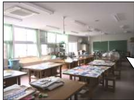
仮設校舎 キッズ・プラザと図工室と 少人数教室が入っています

平成 29 年 4 月の開校に向けて、統合時の校舎となる新山小学校校舎の改修工事を進めています。統合後の児童数に対応した普通教室等の整備など主な改修工事は、夏休み期間中に行いましたが、給食室改修等一部工事が 9 月末頃までかかる予定です。また、今年度 4 月から設置工事をしてきた仮設校舎が 7 月に完成し、キッズ・プラザなどが 8 月から使用を開始しています。