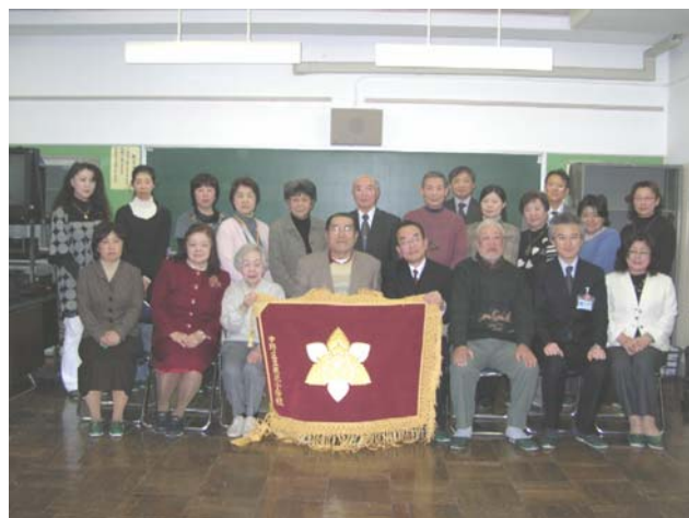
完成した桃花小学校の校旗と統合委員

「桃花小学校」が 3 校のよさや歴史を引き継ぎつつ、新しい学校としての特色を出し、子どもたちにとってすばらしい学校になるよう、これからも保護者や地域の方などと共に温かく見守っていきたいと思います。