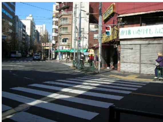
新たに通学路となる中野五差路