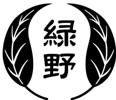
緑野小学校の校章