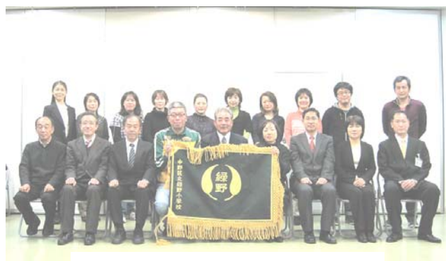
▲緑野小学校の校旗と統合委員会委員

第10回をもって、統合委員会の協議は終了しました。これまで統合委員会の運営にご協力いただき、ありがとうございました。4月には、いよいよ緑野小学校が開校します。すばらしい学校となるよう、これからも見守っていただきたいと思います。