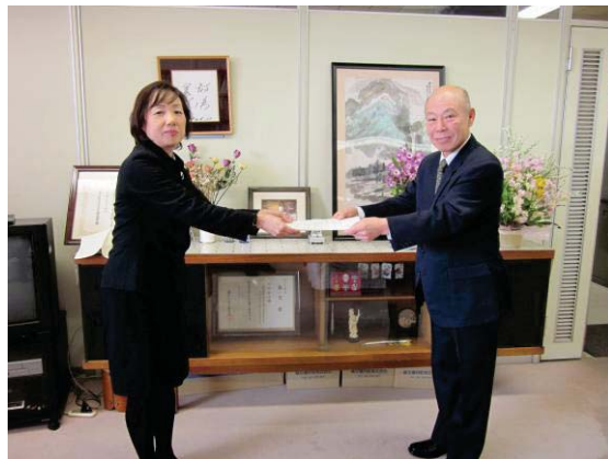
教育長(左)へ報告書を手渡す望月委員長(右)

なお、新しい学校の校名は、今後、教育委員会で協議、議決の後に「中野区立学校設置条例」の一部改正案が区議会に提出され、区議会での議決を得て決定することになります。