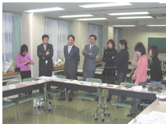
デザイン画を囲み協議する部会の模様