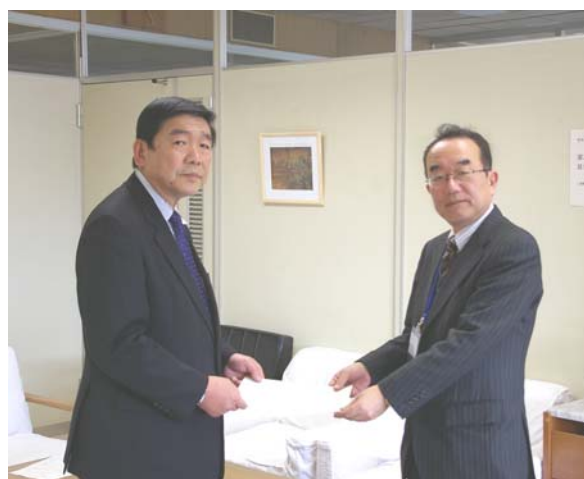
教育長（右）に意見書を手渡す委員長（左）

なお、新しい学校の校名は、今後、教育委員会で協議、議決の後に「中野区立学校設置条例」の一部改正案が区議会に提出され、区議会での議決を得て決定することになります。