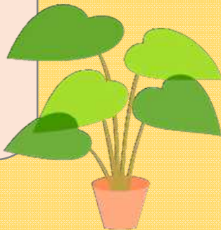
白鷺保育園保育士

1歳児クラスの担任として勤めています。子どもの体調管理をし、園庭や園内で遊んだり、散歩に出かけたりして、子どもたちと関わっています。また食事の介助、子どもの連絡帳や保育日誌等の記入も行います。