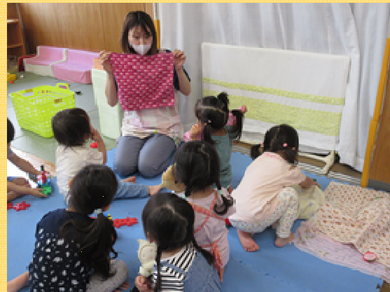
沼袋保育園保育士