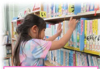
本となかよくなるじかん