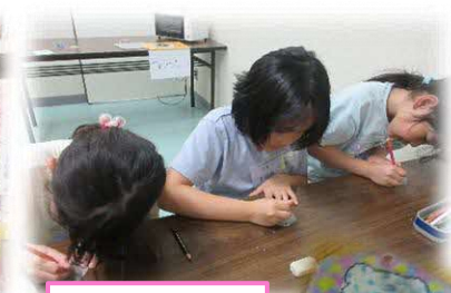
こさく工作ランド