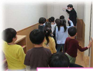
どうやって自分を守るの? (1年生)