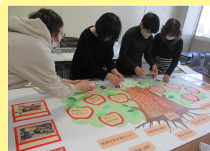
主任児童委員による 新パネル作成の様子