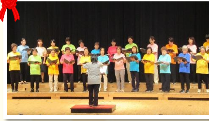
↑ 民生児童員協議会「はとの会」合唱

令和5年11月9日(木)、なかの ZERO 大ホールにて「中野区社会福祉協議会創立70周年式典」が挙行されました。式典には、中野区長をはじめ、多くの方が出席し創立70周年を祝いました。