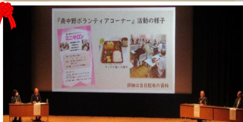
↑ シンポジウムの様子