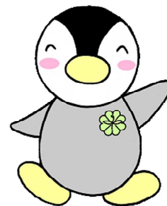
▲東京都民生委員・児童委員のキャラクター「ミンジー」

高齢者世帯、子育て家庭等の見守りなど、さまざまな活動をとおして、日頃から地域で安心して暮らせるようサポートを行っています。