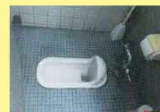
工事前 (元々は男性専用トイレ)

トイレのためにフロア移動することもなくなり、生産効率のアップにもつながっています!