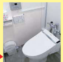
工事後 (女性専用トイレ)

本チラシ記載以外にも要件がございます。申請にあたっては当財団HP掲載の「募集要項」を必ずご確認ください。