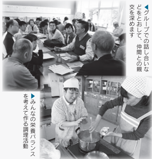
▶みんなの栄養バランスを考えて作る調理活動

詳細は、各館に掲示している利用案内又は図書館ホームページをご覧ください。 なお、各種サービスのご利用にあたっては、図書館の利用登録のほかに、サービスごとの利用登録が必要です。②と③の利用登録は、代理の方または電話でもできます。皆さまのご利用をお待ちしています。