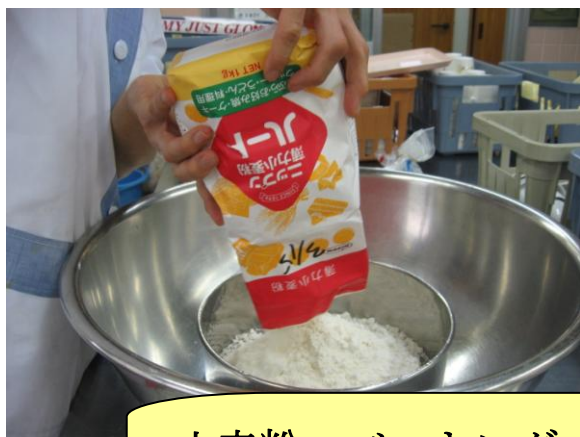
小麦粉・ベーキングパウダーを混ぜる