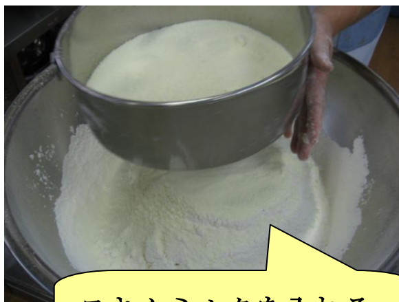
スキムミルクを入れる