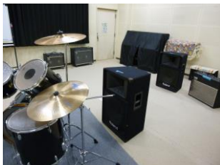
いろいろな機材がある音楽室