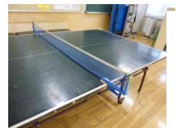
スマッシュを決めろ！

*バドミントンは児童館にあります。ベンチは中学生にペンキを塗り直してもらってピカピカです。