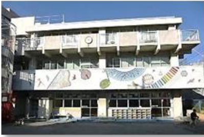
楽しいイラストの外壁 1階が児童館、2・3階は福祉作業所