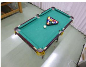
おしゃべりしながら ビリヤード