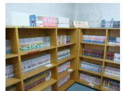
ズラッとそろったマンガのコーナー！

「ハイキュー!!」 「弱虫ペダル」 「ONE PIECE」 「ちはやふる」など。